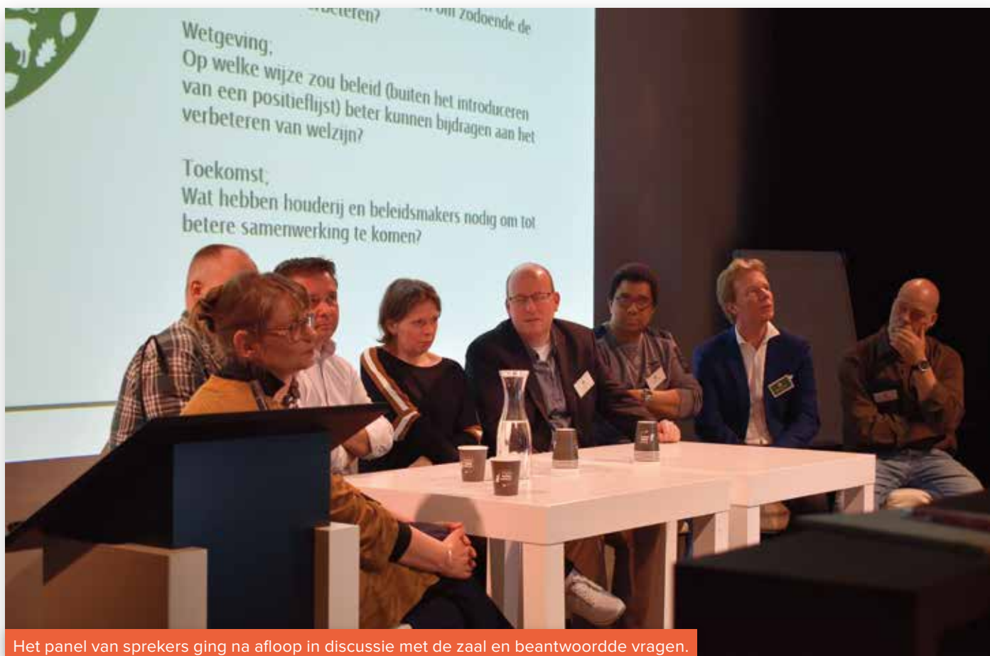
Het panel van sprekers ging na afloop in discussie met de zaal en beantwoordde vragen.