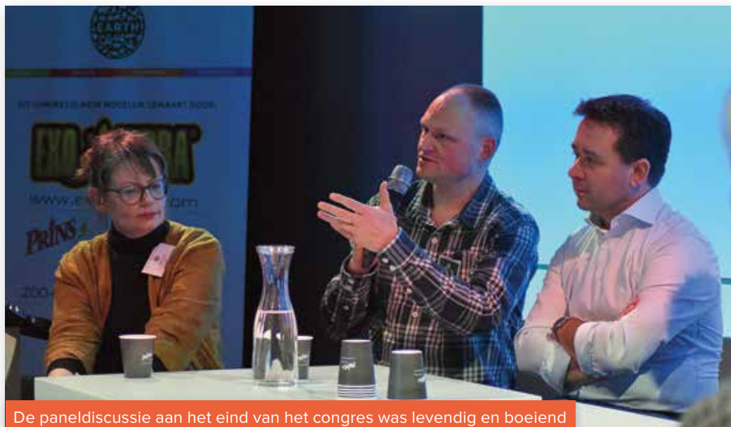
De paneldiscussie aan het eind van het congres was levendig en boeiend