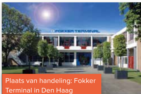
Plaats van handeling: Fokker Terminal in Den Haag

De Fokkersdag is een samenwerking van onder andere de Raad van Beheer, de Nederlandse Databank Gezelschapsdieren (NDG), het ExpertiseCentrum Genetica Gezelschapsdieren, Royal Canin en verschillende specialisten diergeneeskunde. Fokkers, kynologen en andere geïnteresseerden zijn van harte welkom deel te nemen aan dit evenement. De lezingen en paneldiscussies zijn in het Nederlands.