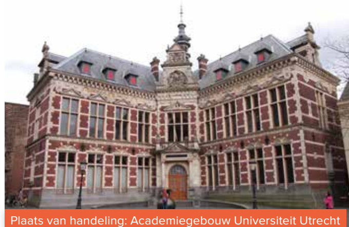
Plaats van handeling: Academiegebouw Universiteit Utrecht

Waar honden 100 jaar geleden werden ingezet als werkkraft, zijn ze nu vaak onderdeel van het gezin. En in de fokkerij heeft de discussie over de selectie op kenmerken die gezondheids- en welzijnsproblemen opleveren ertoe geleid dat dit nu verboden is bij de Wet dieren .