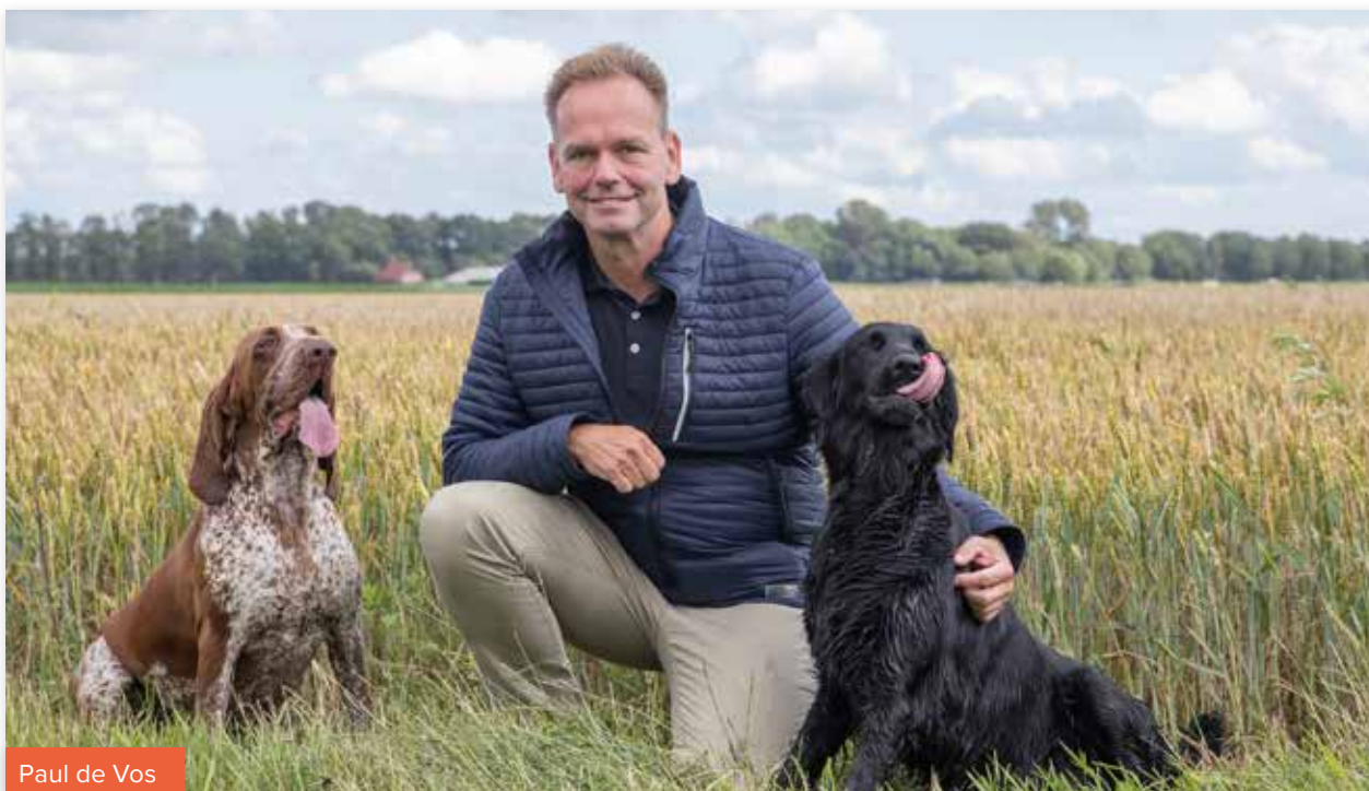
Paul de Vos