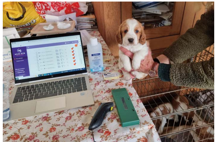
De gegevens van alle tien de Welsh Springer Spaniel-pups (twee nestjes) worden meteen online geadministreerd.

Chippen gebeurt altijd op afspraak, locatiecontroles zijn echter onaangekondigd. Ze vinden plaats als reguliere steekproef, op basis van klachten of wanneer iemand een kennelnaam aanvraagt. De buitendienstmedewerker kijkt dan specifiek naar de leefomgeving, omstandigheden en gezondheid van alle aanwezige honden. Is het hygiënisch? Is de administratie in orde? Zien moederhond en pups er goed uit, zijn ze gezond en vertonen ze normaal sociaal gedrag? Om te voorkomen dat buitendienstmedewerkers een blinde vlek krijgen voor kennels die ze vaker bezoeken, wisselen ze regelmatig van rayon en werkt men bij locatiecontroles volgens het 'vierogen-principe' waarbij er altijd een tweede medewerker uit een ander rayon meegaat. Soms gaat een van de dierenartsen mee, die een medische beoordeling kan maken. Of zo nodig een jurist. Belangrijkste doel is om te zien of er nog wat te verbeteren valt aan de kennel. Hoe doe je dat en hoe kunnen we je daarbij helpen?