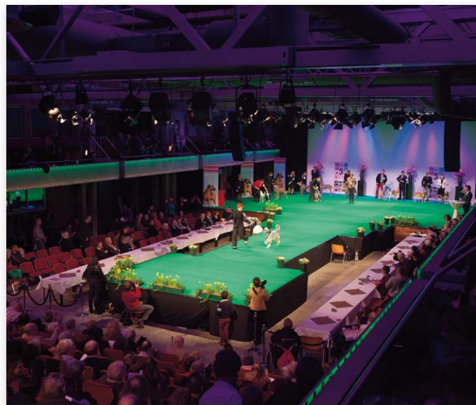
FOTOGRAFIE ERNST VON SCHEVEN

Reductie : € 2,50 reductie met kortingsbon kinderen, 65+ en gehandicapten