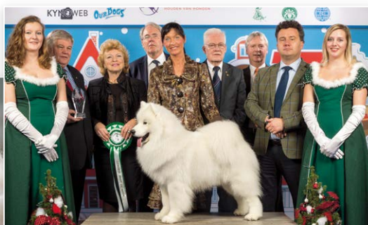
Res. BIS Holland Cup: Samojeed, Cabaka's Happy Go Lucky