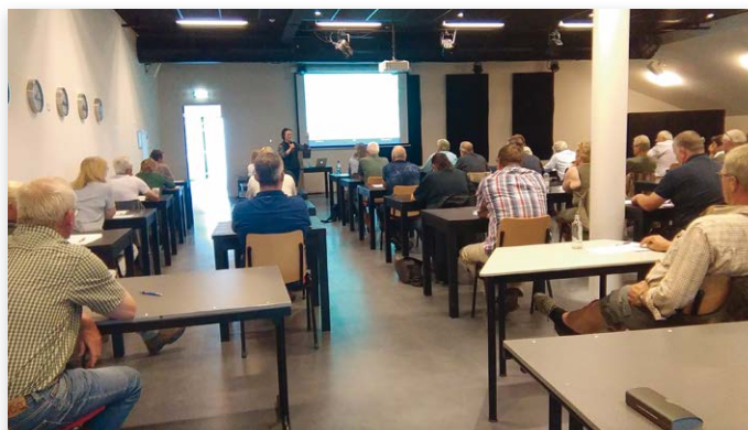
Volle zaal bij het seminar op 4 juni. Een zelfde volle zaal zagen we op 28 mei. In totaal waren er 67 geslaagden!

De Commissie Kynologisch Instructeur (CKI) organiseerde vervolgens een seminar waarin de onderwerpen behandeld werden, die relevant zijn voor een kynologisch instructeur en gebaseerd op de eindtermen voor een benoeming tot kynologisch instructeur. Hiervoor