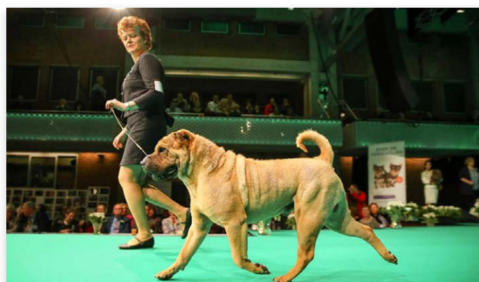
...en aandacht voor je hond.