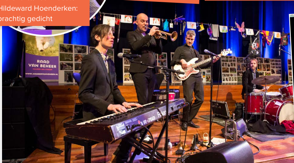
Cabaretgroep MiER had een uitstekende band meegenomen.