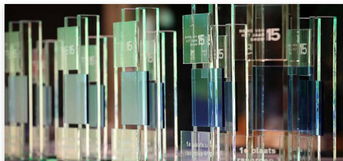
De strak vormgegeven prijzen lonkten, maar slechts enkele deelnemers konden er een in ontvangst nemen.