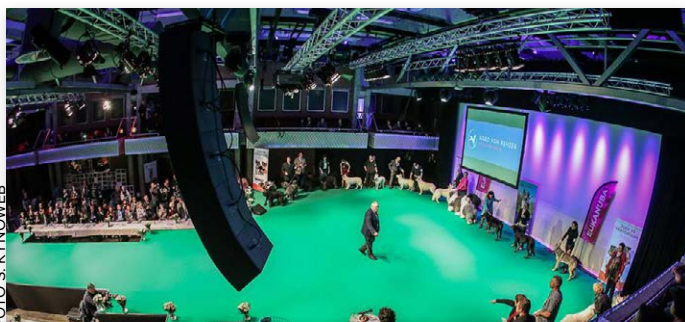
Op deze geweldige catwalk kwamen de deelnemende honden prachtig tot hun recht.