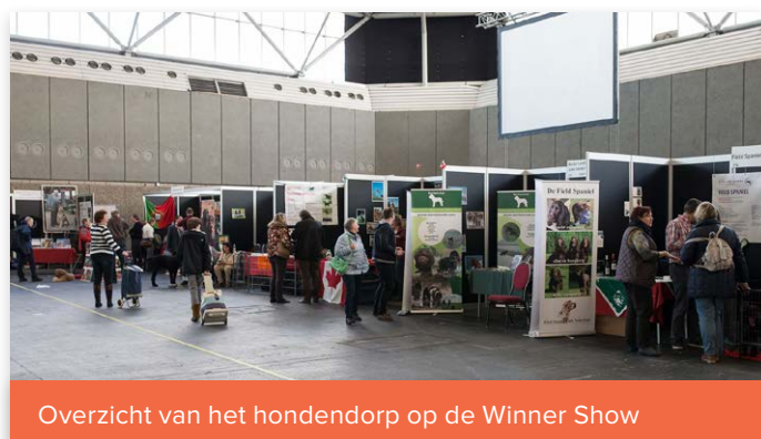
Overzicht van het hondendorp op de Winner Show