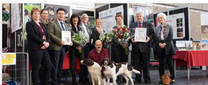
Winnende stand was die van de Drentsche Patrijshonden Club Nederland. Behalve de titel wonnen ze ook gratis standruimte voor volgende keer.