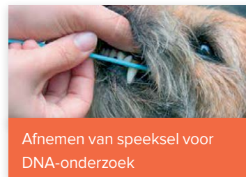
Afnemen van speeksel voor DNA-onderzoek

Er bereiken ons regelmatig vragen van leden over de kwaliteit van de DNA-databank. De Genotek swabs zijn al bij meerdere wetenschappelijke onderzoeken gebruikt, waarbij het DNA van voldoende kwaliteit en kwantiteit was.