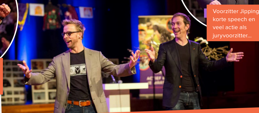
Cabaretgroep MIER leidde de bijeenkomst op onnavolgbare wijze: snel, snedig, ad rem en heel grappig!

en -blaffen en zat er meteen helemaal goed in. Hildeward Hoenderken las