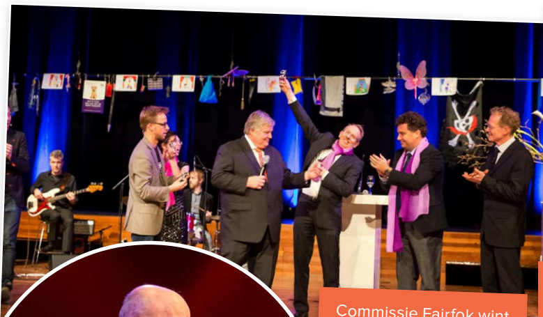
Commissie Fairfok wint de Gouden Stuiver...