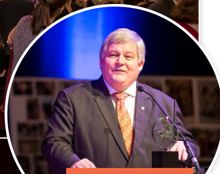
Voorzitter Jipping: korte speech en veel actie als juryvoorzitter...