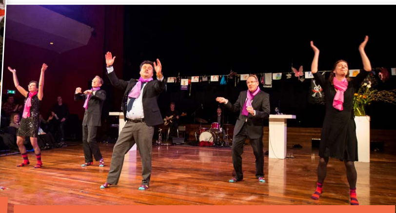
De commissie Fairfok in actie. Van klassiek ballet mondde hun act uit in wilde dans op 'Happy' van Pharrell Williams