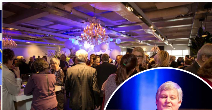
Een geweldige opkomst: in totaal kwamen er ruim 350 mensen naar het Spant!