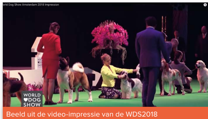
Beeld uit de video-impressie van de WDS2018

De beweringen die Dier&Recht doet over het gedrag en het welzijn van de honden tijdens hondenshows, zijn niet juist. Nederland loopt voorop als het gaat om dierenwelzijn tijdens hondenshows. Alle aandacht is gericht op "Fit For Function". Dat betekent dat de keurmeesters geïnstrueerd zijn om op het welzijn, het gedrag en de uiterlijke kenmerken te letten. Speciale instructies voorzien er in dat zij niet alleen verplicht zijn te letten op de gezondheid van de te keuren honden, maar daar ook naar handelen in hun beoordelingen, kwalificaties en prijzen. Ook buiten de keuringsring zorgen we voor het welzijn van de dieren.