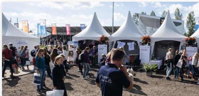
Op het Recreatieplein trokken stands van diverse rasverenigingen veel aandacht

De zeventiende editie van Horse Event stond in het teken van vernieuwing: een nieuwe locatie bij Expo Haarlemmermeer, én een andere indeling. Deze nieuwe aanpak moest paarden- en hondenliefhebbers uit alle hoeken van het land een onvergetelijke dag bezorgen. Er kwamen maar liefst 42.500 bezoekers op af, de tribunes zaten afgeladen vol. De Raad van Beheer was ook van de partij met een stand waar het publiek alles te weten kon komen omtrent stamboomhonden.