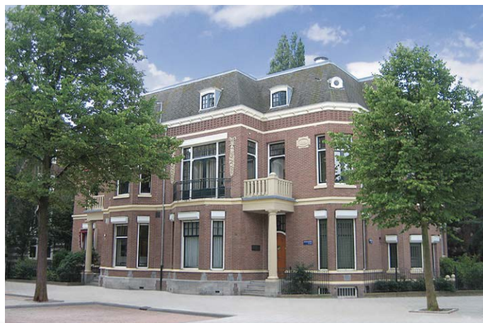
Foto van het pand in aanbouw 1918 naast de foto het kantoor anno 2018. Het pand is op beide foto's vanuit exact dezelfde hoek gefotografeerd