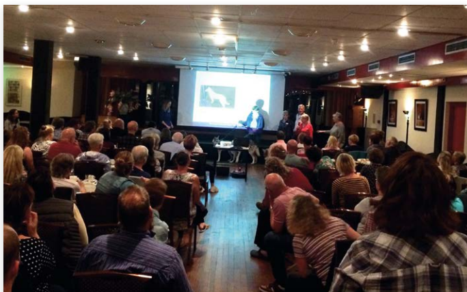
Andermaal veel belangstelling voor dit onderwerp

Wegens grote belangstelling organiseerden wij op 11 september jl. samen met de Werkgroep Fokkerij en Gezondheid in Woudenberg een tweede verdiepingsavond over look-alikes en outcross. Ook deze avond trok weer veel bestuurders, leden van fokadviescommissies, fokkers, maar bovenal liefhebbers.