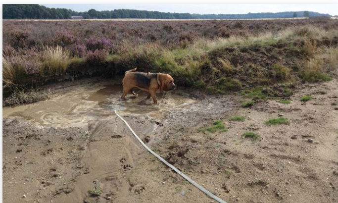
De hond loopt aan een tuig waarin hij makkelijk loopt, met een lange lange lijn eraan