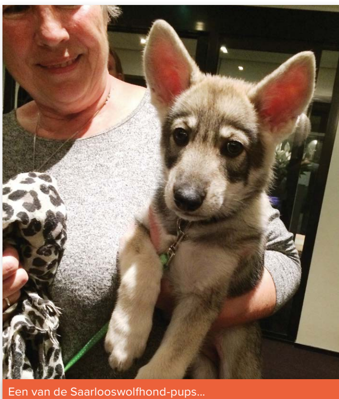
Een van de Saarlooswolfhond-pups...