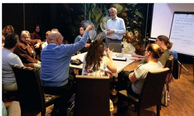
Er werd intensief gediscussieerd in diverse groepen geleid door deskundigen