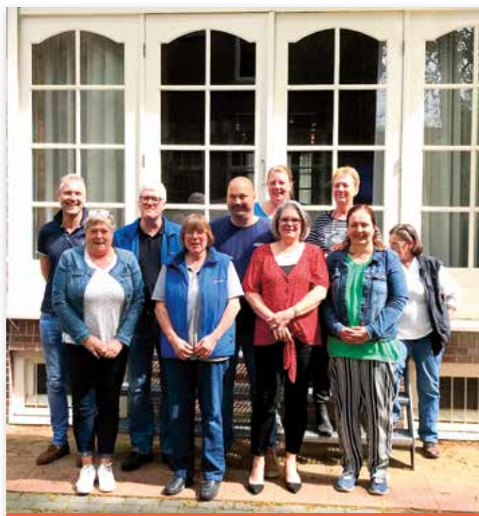
Ons team buitendienstmedewerkers. Maak een afspraak met uw regionale medewerker voor een servicegesprek.

Heeft u een nestje, dan moeten de pups gechipt worden. Daarvoor maakt onze buitendienstmedewerker een afspraak met u. Heeft u behoefte aan ondersteuning, bijvoorbeeld omdat dit uw eerste nestje is, of heeft u meerdere vragen, geef dit dan meteen bij het maken van de afspraak aan. Dan maakt de medewerker extra tijd vrij voor een langer bezoek.