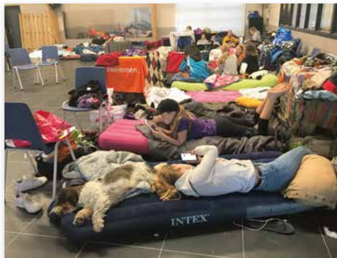
En dan chillen op de slaapzaal...