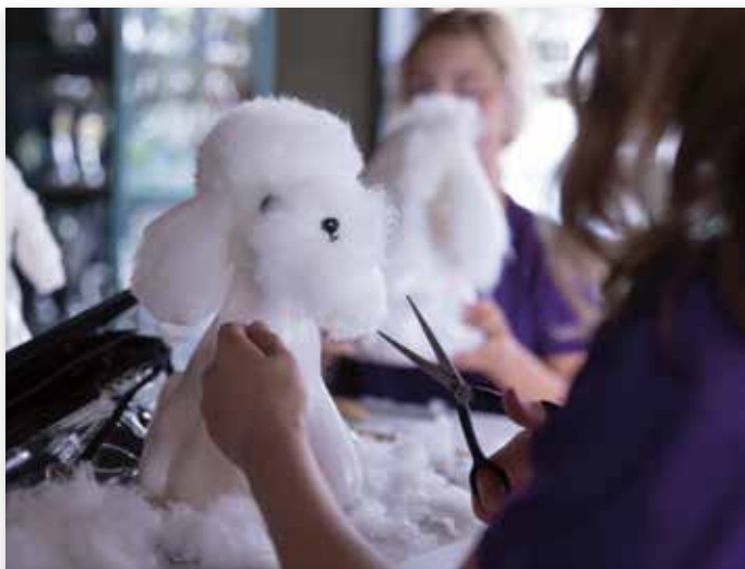
Grooming, met als opdracht een fantasiekapsel te creëren...