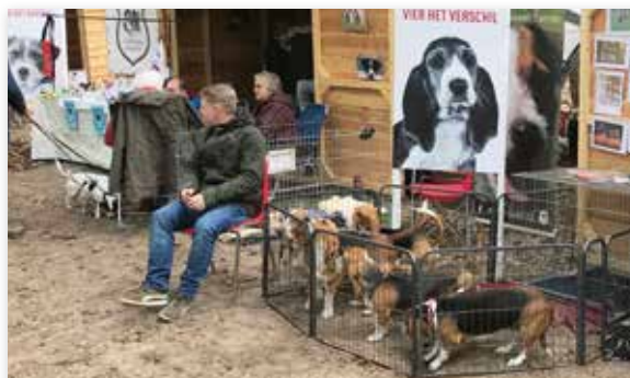
U ontmoet diverse rasverenigingen op Animal Event

De Beekse Bergen in Hilvarenbeek wordt begin mei omgetoverd tot een dierenfestival met diershows, hondenworkshops, gezellige terrassen, verrassend straattheater en muziekacts. Ook worden er tal van educatieve clinics, workshops en lezingen gegeven.