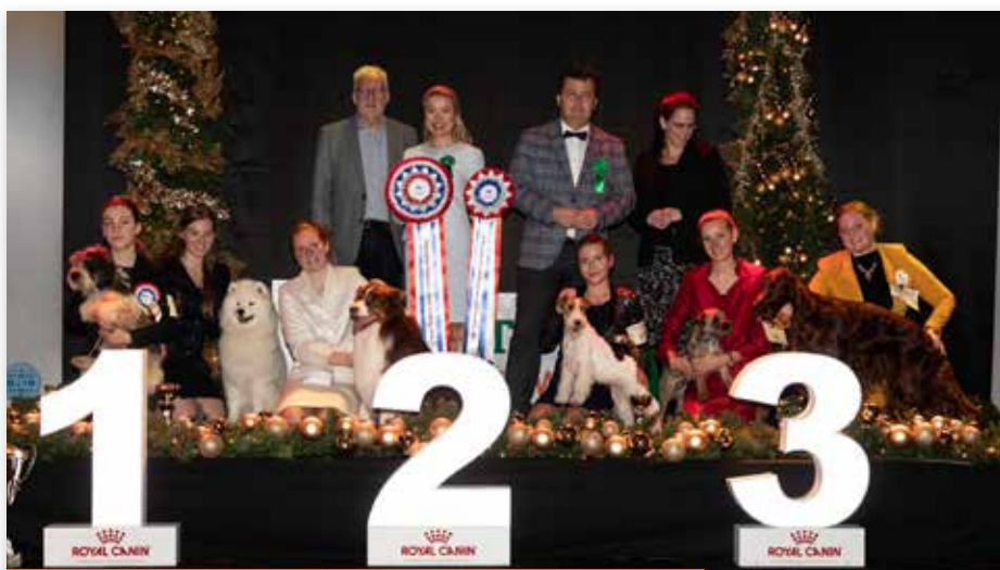
De zes finalisten Junior Handling gezusterlijk bij elkaar...

Voorafgaand aan de eindkeuringen op zaterdag 21 december vond traditiegetrouw de Nederlandse Finale Junior Handling plaats, waar jeugdige handlers aan meedoen tot en met 17 jaar.