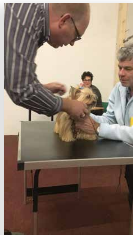
Tijdens de praktijkdag worden lastige praktijksituaties geoefend