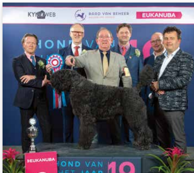
Reserve-BIS werd de Bouvier des Flandres Cash-Uschi v.d. Vanenblikhoeve van W. Visser & W. Visser