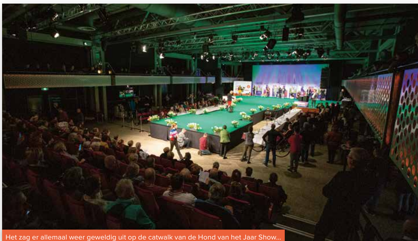
Het zag er allemaal weer geweldig uit op de catwalk van de Hond van het Jaar Show...