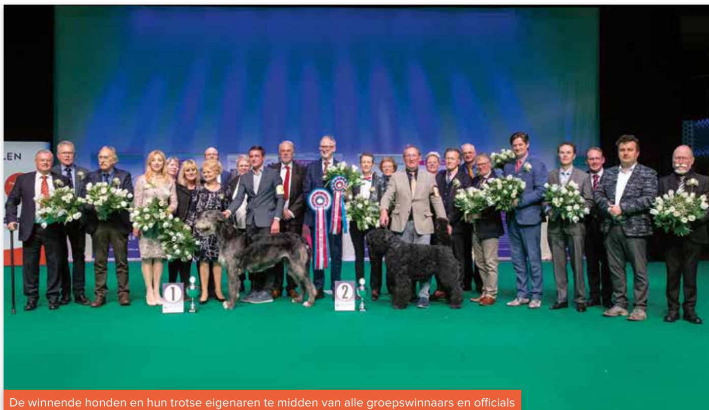
De winnende honden en hun trotse eigenaren te midden van alle groepswinnaars en officials