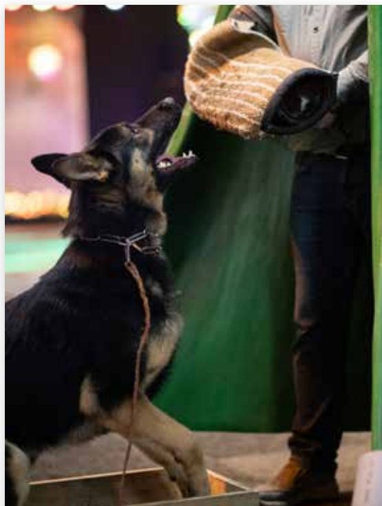
Demonstratie IGP/Werkhonden, hier bij het pakwerk...

de honden niet gewend om in deze omstandigheden te trainen, ze lieten zich er over het algemeen niet door afleiden en waren goed geconcentreerd bezig. Mooi om te zien! Een aanrader voor iedere hondengeleider om eens in een totaal vreemde situatie te trainen met je hond. Wat ons betreft zeker voor herhaling vatbaar!