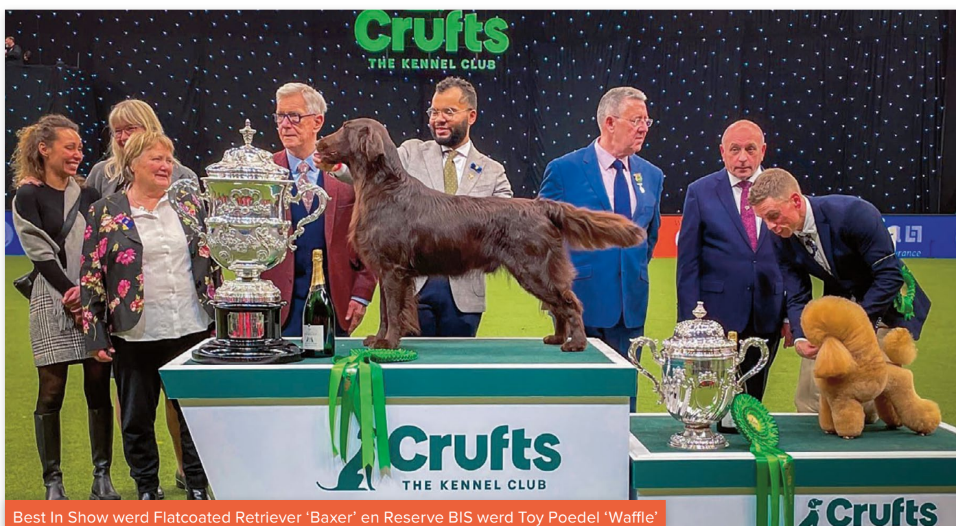
Best In Show werd Flatcoated Retriever 'Baxer' en Reserve BIS werd Toy Poedel 'Waffle'