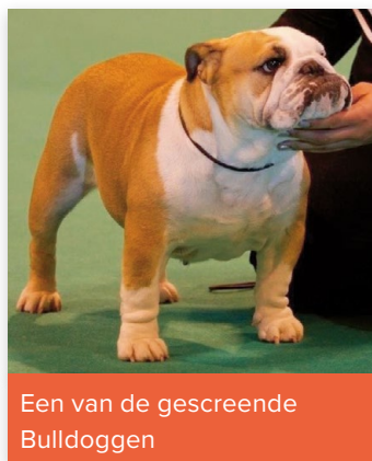
Een van de gescreende Bulldoggen

hoorbare ademhaling in de buurt van de ring. Dit is een enorme verbetering vergeleken met tien jaar geleden. De functionele test op basis van het Cambridge University-systeem heeft zeer positieve effecten bij gebruik door verantwoordelijke fokkers.'