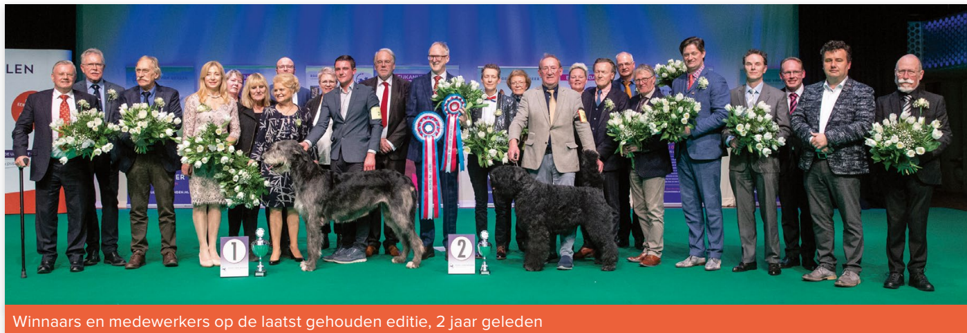
Winnaars en medewerkers op de laatst gehouden editie, 2 jaar geleden

Op 2 april aanstaande organiseert de Raad van Beheer in het Event Center Dordrecht de Hond van het Jaar Show 2020 & 2021. Inschrijven voor deze Hond van het Jaar Show gaat dit jaar voor het eerst via Onlinedogshows.eu . De eigenaren van de geselecteerde honden hebben inmiddels een e-mail ontvangen met hierin een uitnodiging om in te schrijven.