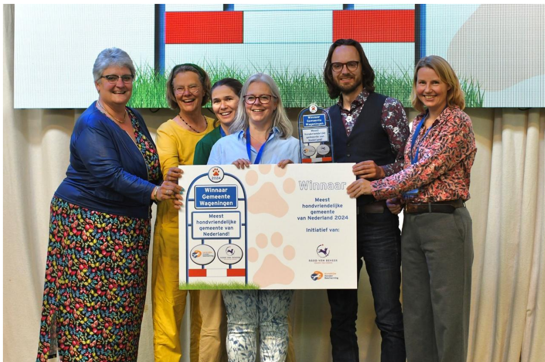
Wageningen – Meest Hondvriendelijke Gemeente van Nederland 2024

In juni 2025 reikten we samen met de Koninklijke Hondenbescherming de prijs uit aan de gemeente Wageningen, Meest Hondvriendelijke Gemeente van Nederland 2024. De jury prees onder meer de samenwerking met werkgroep “Hondenvrienden Wageningen”, de losloopgebieden, gratis poepzakjes, het maaibeeld voor grasaren en de inzet van de hondenbelasting voor het hondenbeleid. Den Haag en Haarlemmermeer eindigden als sterke nummers twee en drie.