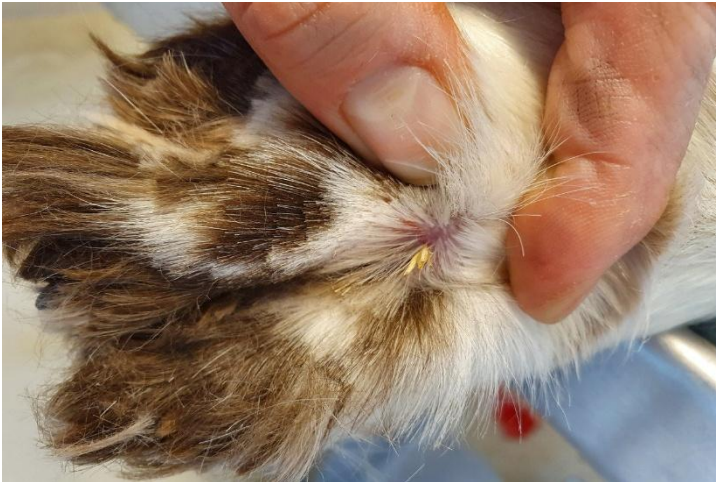
Grasaar uit poot verwijderen

Voor kinderen publiceerden we 10 gouden regels om veilig en plezierig met honden om te gaan, van “aai liever rustig dan omhelzen” tot “laat honden eten en slapen in rust”.