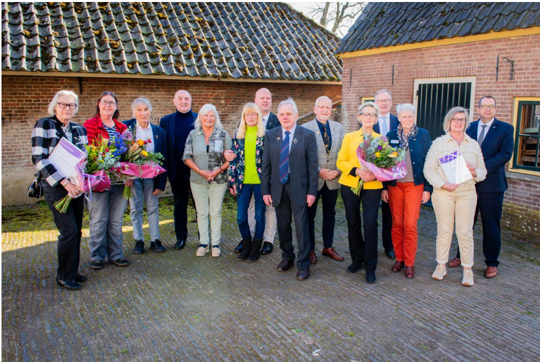
Uitreiking van de Erespelden – het hoogtepunt van het kynologisch jaar