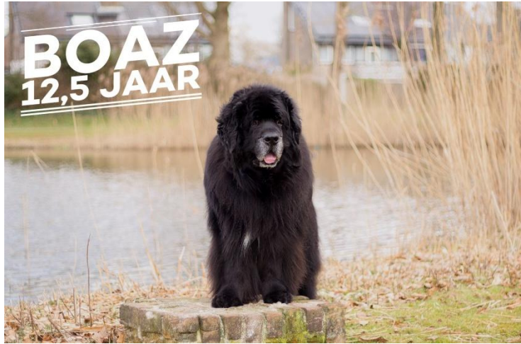
Boaz, 12,5 jaar – levend bewijs van vitale rashonden

In 2025 gaven we onze seniorhonden opnieuw een prominente plek. Op de website verscheen een uitgebreide pagina over de ouder wordende hond met informatie over preventieve zorg en ouderdomssignalen. In het interview met Carina Klijn vertelde zij over haar nog vitale seniorhond Theuntje. In november deelden honden-liefhebbers via Facebook hun verhalen en foto's, een eerbetoon aan honden die zorgvuldig gefokt gezond en vitaal oud zijn geworden.