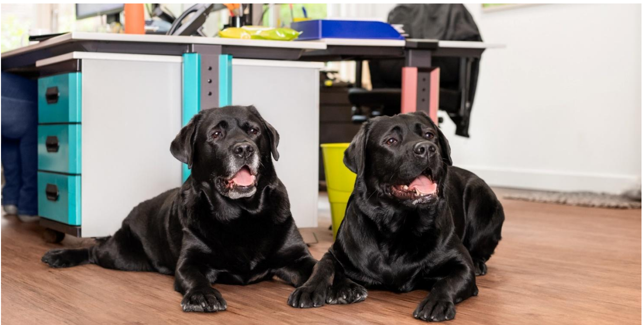
Onze kantoorhonden – ambassadeurs op de werkvloer

Bij de Raad van Beheer zijn meer dan 290 verenigingen aangesloten. Dit zijn rasverenigingen, lokale kynologenclubs en bijzondere verenigingen. Deze verenigingen kiezen via de Algemene Vergadering een bestuur. Het bureau van de Raad van Beheer ondersteunt het bestuur in de voorbereiding, vorming en uitvoering van het beleid. Bij het bureau werken zo'n 35 personen.