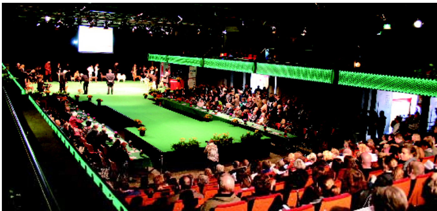
Op zondag 23 februari vormt 'De Flint' in Amersfoort weer het decor voor de Hond van het Jaarshow.