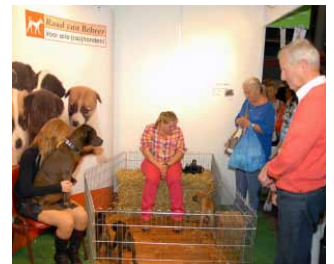
▶ Volop aandacht voor de puppy party in de stand van de Raad van Beheer.

Uiteraard verwezen de medewerkers bezoekers van de stand ook door naar de lokale kynologen clubs. De Raad van Beheer bekijkt de mogelijkheid om ook volgend jaar weer deel te nemen aan dit evenement.