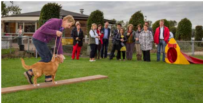
Aandacht voor positieve opvoeding bij KC Gorinchem.

Het bezoek van de medewerkers van het ministerie werd afgesloten met een ontvangst door de Kynologen Club Gorinchem en Omstreken. Deze club gaf diverse demonstraties, onder andere behendigheid en gedrag & gehoorzaamheid.