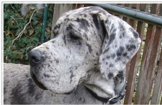
De Duitse Dog grijstijger

De Fédération Internationale Cynologique (FCI) heeft eind 2013 een circulaire gezonden aan de aangesloten leden en contract partners met betrekking tot de kleuren bij de Duitse Dog.