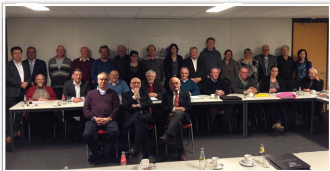
De deelnemers aan het verkennend gesprek over de Ledenraad.

Op 14 januari jl. kwamen de vertegenwoordigers van de rasgroepen en rayons met het bestuur en de directie van de Raad van Beheer bijeen in het kader van de Ledenraad. De Ledenraad, ooit in het leven geroepen als adviescommissie voor het bestuur, was tot dat moment al enige tijd niet meer actief, mede omdat op diverse onderdelen in diverse werkgroepen werd gesproken over de ontwikkeling en voorbereiding van beleid en regelgeving.