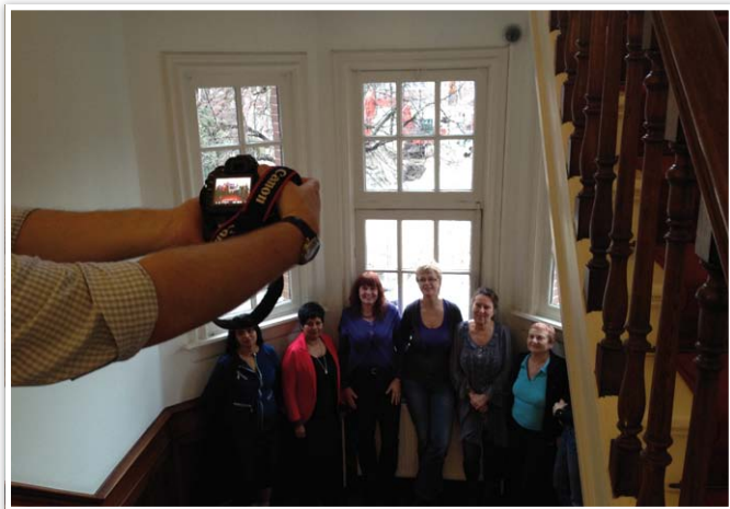
De afdeling stamboekhouding wordt op de foto gezet voor het Mei-nummer van Onze Hond]

In het meinumner van het kynologisch maandblad Onze Hond (verschijnt eind april) wordt een artikel gepubliceerd over de afdeling Stamboekhouding. Daarin maakt u kennis met de vele en veelzijdige werkzaamheden van de medewerkers. In volgende edities van het komende jaar kunt u kennis maken met de andere afdelingen van de Raad van Beheer.