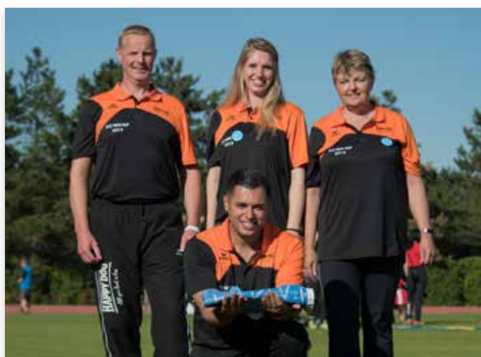
Overdracht FCI-vlag voor WK 2020