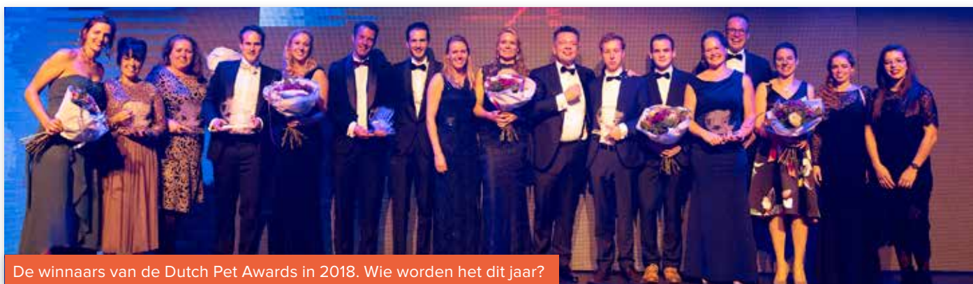
De winnaars van de Dutch Pet Awards in 2018. Wie worden het dit jaar?