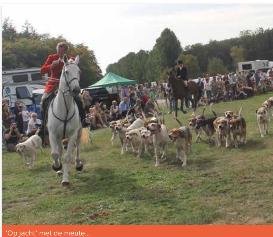
'Op jacht' met de meute...