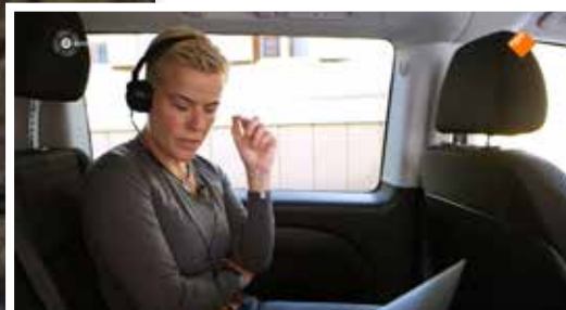
Enkele video-stills uit de uitzending van 14 oktober...