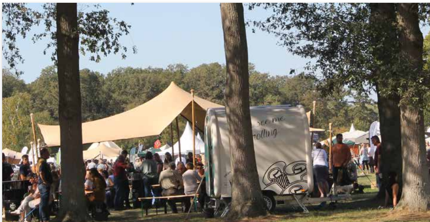
Het festivalterrein van Jacht en Buitenleven op landgoed Velder, een mooie locatie...

De uitdaging: organiseer een Kampioenschapsclubmatch voor de Franse Basset in de sfeer van de Nationale d'élevage, de clubmatch van onze Franse zustervereniging. In Frankrijk kun je als vereniging makkelijk aansluiten bij een 'Fête de Chasse', een jachtfestijn in de tuin van een chateau. Tal van Franse jachthondenrassen geven daar acte de présence . Een entourage met mooie meutes, jachtkleding, jachthoorns, kunst, kaas en wijn. Zie dat maar eens in Nederland te realiseren!