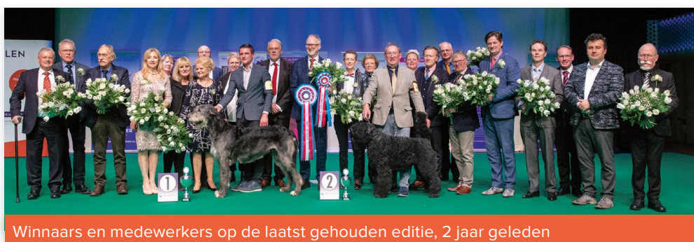
Winnaars en medewerkers op de laatst gehouden editie, 2 jaar geleden

In verband met de COVID-pandemie kon de Hond van het Jaar show 2020 vorig jaar niet plaatsvinden. Op 2 april wordt de show daarom voor zowel 2020 als 2021 gehouden. Voor de Hond van het Jaar Show 2020 & 2021 worden honden uitgenodigd die zich in 2020 en/of 2021 hebben gekwalificeerd.